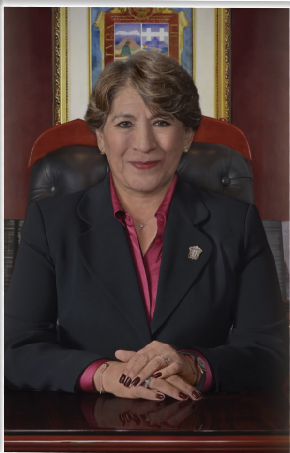
Mtra. Delfina Gómez Álvarez Gobernadora del Estado de México