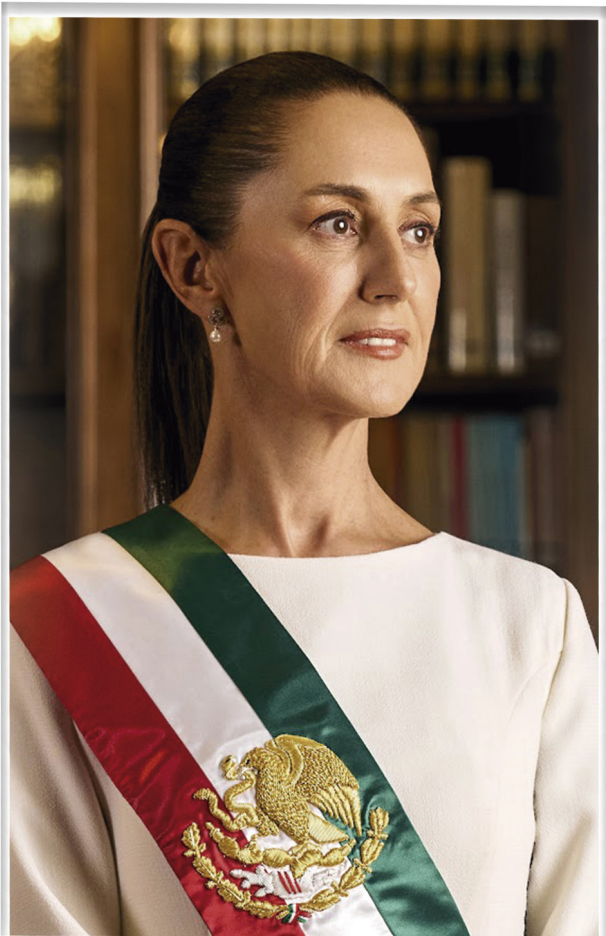
Dra. Claudia Sheinbaum Pardo Presidenta Constitucional de los Estados Unidos Mexicanos